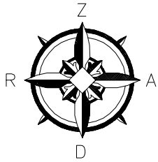
Objekta novietojuma shēma